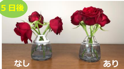
■抗菌ホルダーの有無で比較実験 (社内調べ)