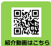
紹介動画はこちら