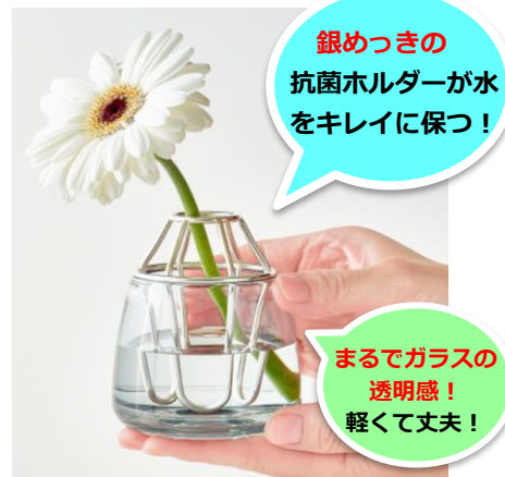
■さまざまなシーンに合うコンパクトなサイズ感

切り花が日持ちしないのは水中の雑菌の増殖が原因。銅などの金属には抗菌性がありますが、さまざまな種類の金属めっきで実験を重ねたところ銀の抗菌力がお花に最適と分かりました。こうして銀めっきを施した抗菌ホルダーが完成。お花を支え、水までキレイに保ちます。ホルダーは中央のリングだけでなく、サイドにも挿せるのでお花の量を選ばずさまざまなアレンジを楽しめます。ホルダーを支え、水を入れる容器は注目の新素材「Tritan™（トライタン）」樹脂を採用。まるでガラスのような透明感がありながら、軽くて丈夫。小さなお子様やペットを飼っているお家でも嬉しいポイントです。