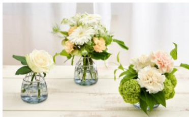
■お花の量を選ばず多彩なアレンジが可能