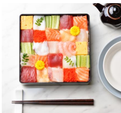
●ゆびさきトングで作ったモザイク寿司

華やかな女の子のお祝いにふさわしい彩り美しいちらし寿司は、ケーキ寿司や手まり寿司、ドーナツ寿司など、時代とともにさまざまな形をかえつつ楽しまれています。2017年のひなまつり、おそらく一番人気のちらし寿司は、昨年からinstagram等で盛り上がっている『モザイク寿司』です。作り方はいたって簡単、お重に酢飯を詰めて、均等に切った魚や卵、野菜を彩りよく置くだけ。あっという間にトレンド感あふれるフォトジェニックなモザイク寿司が完成します。